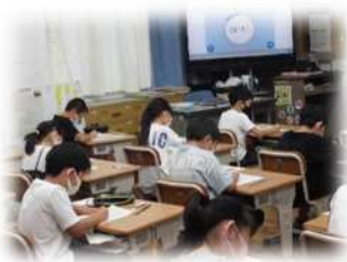
〈さんタイムの様子〉

本校では、「かしこい子」を目指すために、「基礎基本を身に付けた子」を重点目標に設定しました。その具体的な活動として、昨年度より金曜日の朝の活動を「さんタイム」と名付け、算数の「数と計算」領域の基礎基本の定着を目指して活動してきました。本年度4月に行われた計算力テストでは、市の平均を上回る学年も出てきました。少しずつ指導の成果が表れてきたのではないかと考えています。