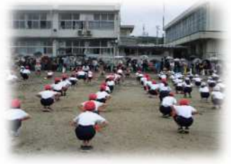
〈スポーツフェスティバル〉

スポーツフェスティバルでは、3つの目標を意識して、進めてきました。一つ目は、「新たな友達や教師と一つのものを作り上げることを通して集団への所属感、達成感を味わわせること」、二つ目は「競技を通して仲間と切磋琢磨し、仲間と運動することを楽しみながら、体力の向上を図ること」、三つ目は、「目標に向かってチャレンジし、粘り強く取り組む態度を育てること」でした。子供たちの振り返りや担任の感想から、おおむね目標が達成できたのではないかと考えています。