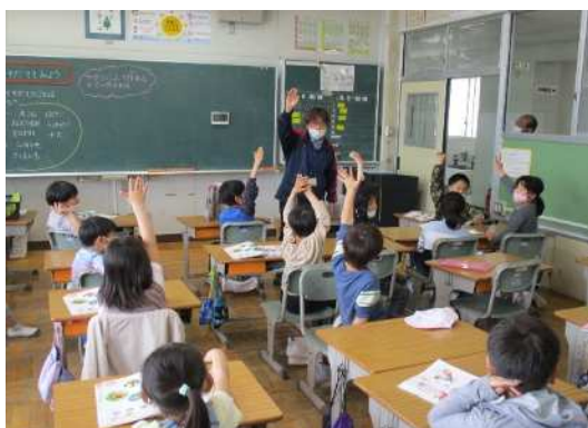
委員による授業参観